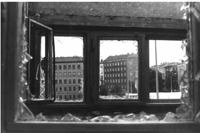
Horst Sturm. Blick aus dem Wachturmfenster. 1992 Sturm_Wachturmfenster.jpg

Sie alle lassen sich von den unverwechselbaren Stadtmotiven inspirieren, geben Lebensgefühl und Wertsicht wieder. Wasserturm und Kulturbrauerei, namenlose Hinterhöfe, Hauseingänge und Straßenschluchten weniger dokumentiert als interpretiert zu sehen, ist unterhaltsam wie erhellend. Wer will, kann sich das auch mit nach Hause nehmen.