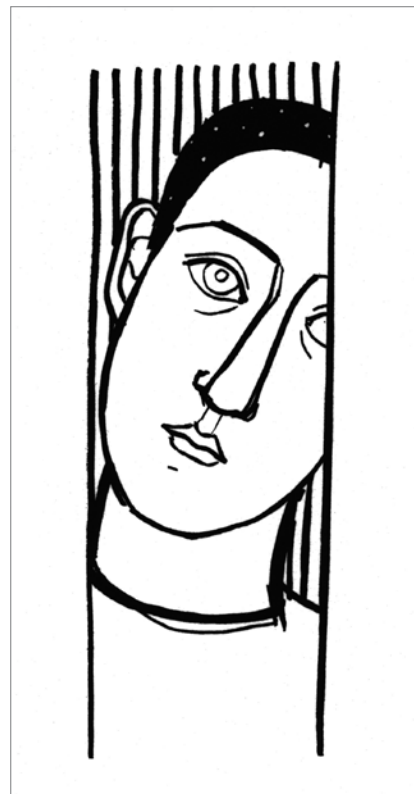
Max Stock. Fenster. 2008 Siebdruck. 41 x 15 cm – Stock_Fenster.jpg